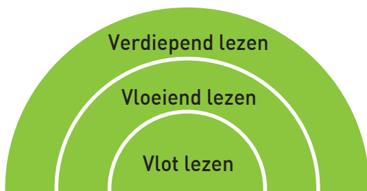
Figuur 1 De niveaus van leesvaardigheid: vlot, vloeiend en verdiepend lezen.

Technisch kunnen lezen is een voorwaarde om begrijpend te kunnen lezen. Daarvoor onderscheiden we drie niveaus in leesvaardigheid, namelijk vlot, vloeiend en verdiepend lezen.